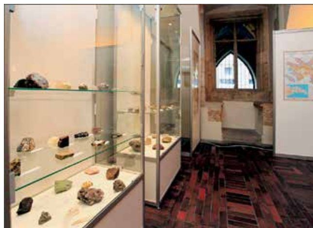
Výstava Prezentace ázerbájdžánské geologie v ČR, cenné minerály a zkameněliny přivezené z Ázerbájdžánu