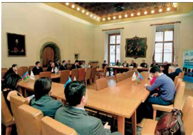
Kulatý stůl, Karolinum, Malá aula 3. 12. 2014